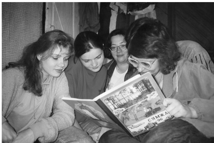
Фото 2: Участники экспедиции читают страницы своего дневника